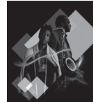
David Murray Quartet feat. Saul Williams