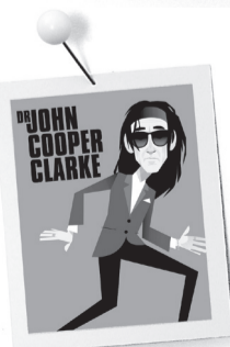
JOHN COOPER CLARKE